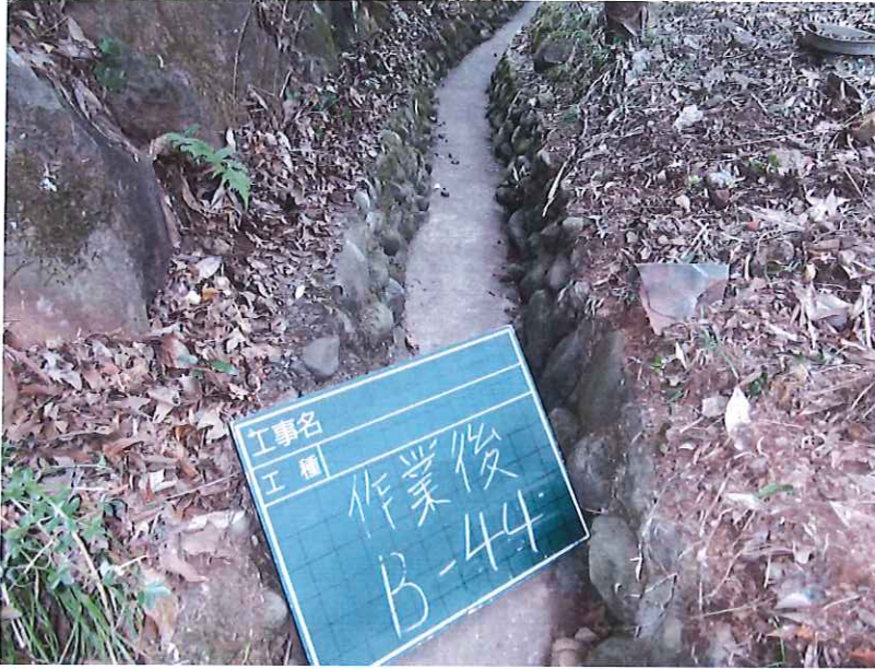
水路沿い草刈完了写真