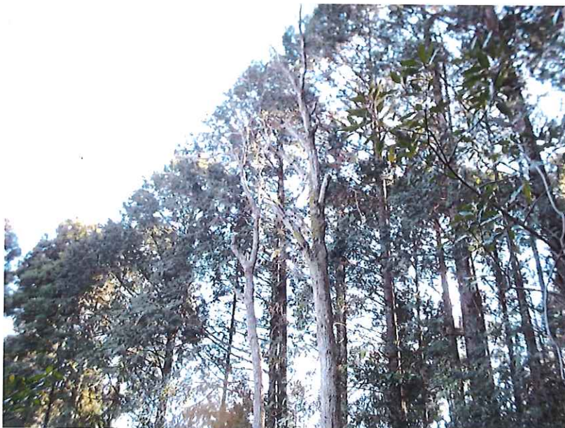
管理地北西より撮影。