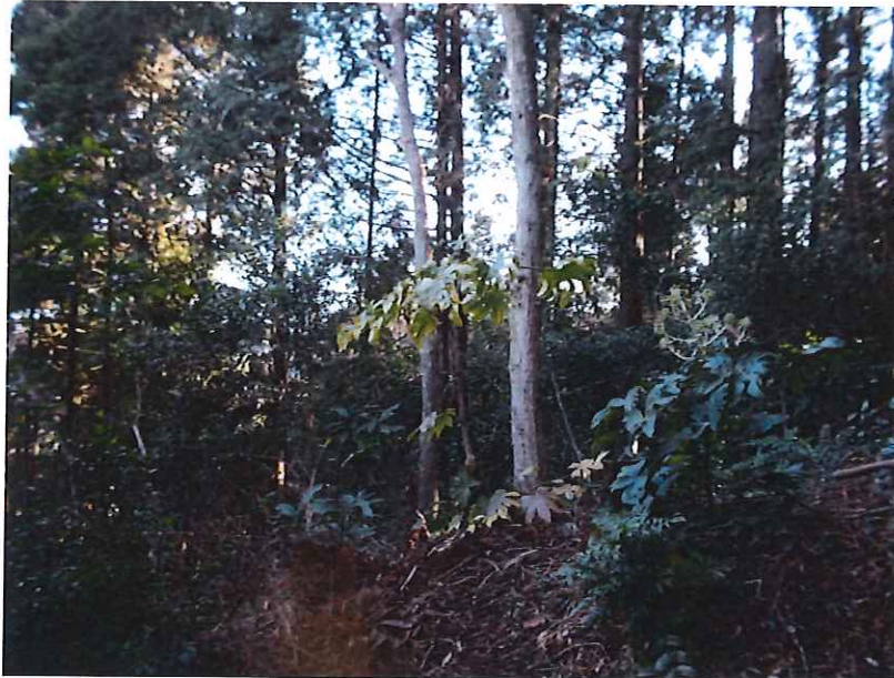
同上写真根元付近です。