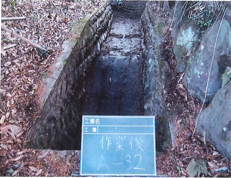
水路沿い草刈完了写真