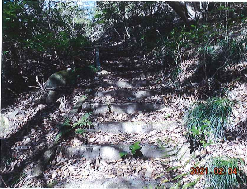
道路清掃(清掃車侵入不可箇所) 清掃前