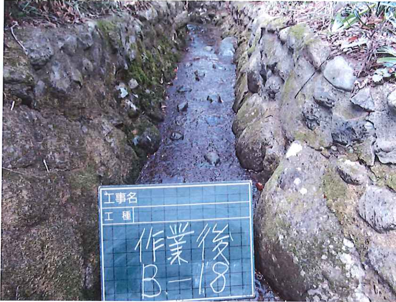
水路沿い草刈完了写真