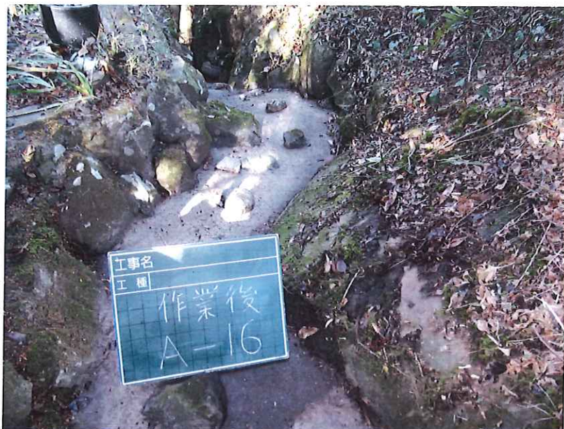
水路沿い草刈完了写真