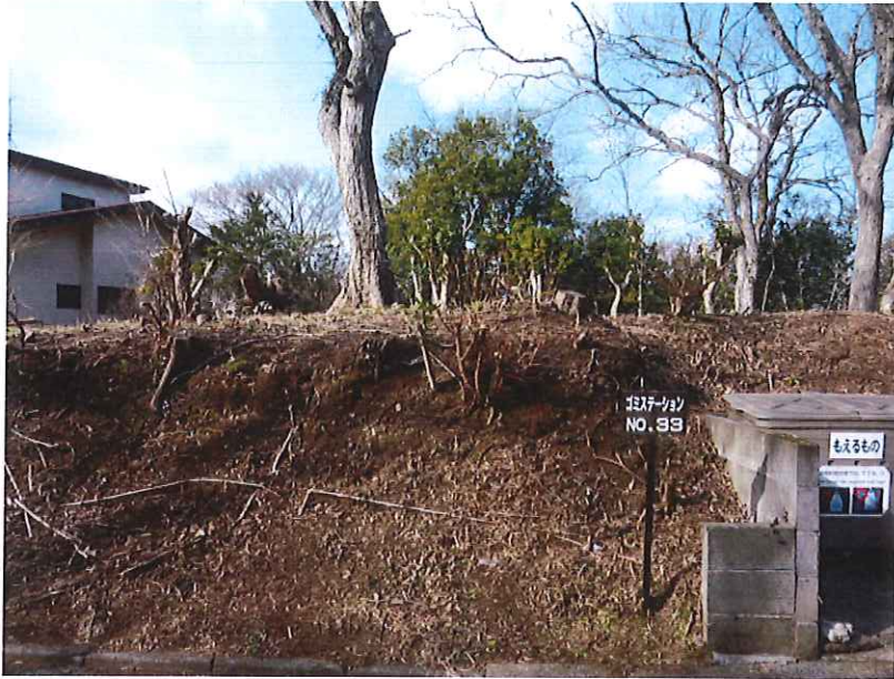
ゴミステーションNo.33付 近管理地草刈作業 施行完了 正面より撮影