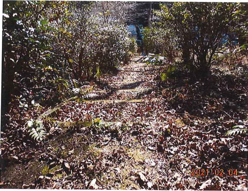
道路清掃(清掃車侵入不可箇所) 清掃前