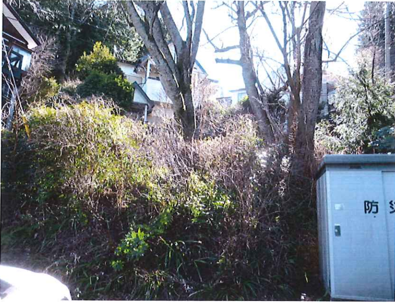
ゴミステーションNo.8付近 管理地草刈作業 施行前 正面より撮影