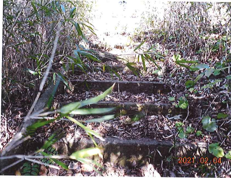
道路清掃(清掃車侵入不可箇所) 清掃前