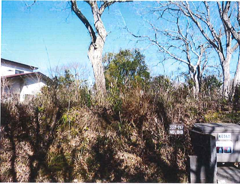
ゴミステーションNo.33付 近管理地草刈作業 施行前 正面より撮影