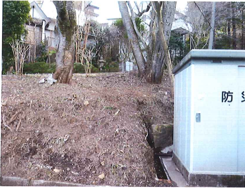
ゴミステーションNo.8付近 管理地草刈作業 施行完了 正面より撮影