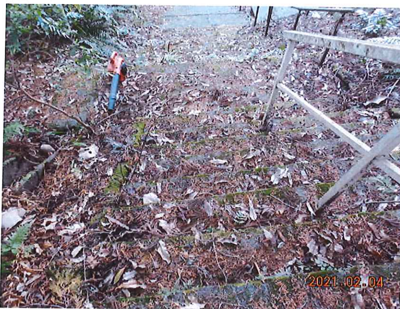
道路清掃(清掃車侵入不可箇所) 清掃前