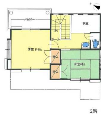
※図面と現況が異なる場合は現況を優先します。